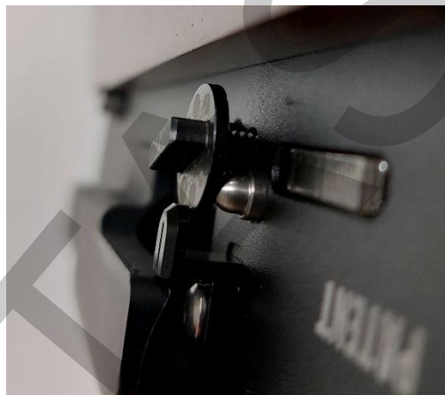
Nejvyšší možný výkon (po doraz).

Pušky Evanix jsou vyráběny podle nejvyšších možných standardů a využívají nejkvalitnějších materiálů, které poskytují životnost. V nepravděpodobném případě, že během prvních 24 měsíců po nákupu došlo k jakýmkoliv závadám na materiálech nebo zpracování, opravíme nebo vyměníme pušku v záruce.