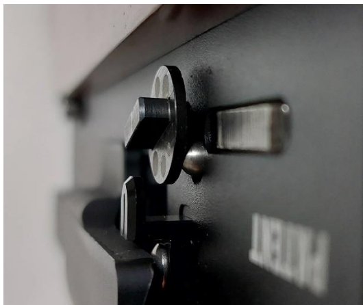
Nejnižší možný výkon

Otáčením ve směru hodinových ručiček výkon snižujete. Otáčením proti směru hodinových ručiček výkon zvyšujete.