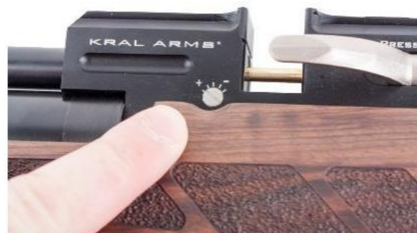
Obrázek B – Levá strana regulátoru