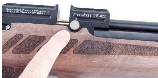
Obrázek A – Ventil regulátoru

Ventil regulátoru je umístěn na pravé straně těla zbraně ( obrázek A ). Hodnotu nastaveného tlaku můžete zkontrolovat na levé straně těla ( obrázek B ).