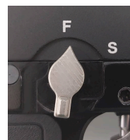
Odjištěná pojistka - zbraň připravena vystřelit.