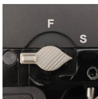
Zajištěná pojistka proti výstřelu.

Manuální pojistka se nachází na pravé straně, nad spouští. K zajištění jí stačí posunout prstem. Bezpečnostní pojistka je zajištěna proti výstřelu v pozici SAFE "S". Pro odjištění zbraně přesuňte pojistku do pozice "FIRE" "F".